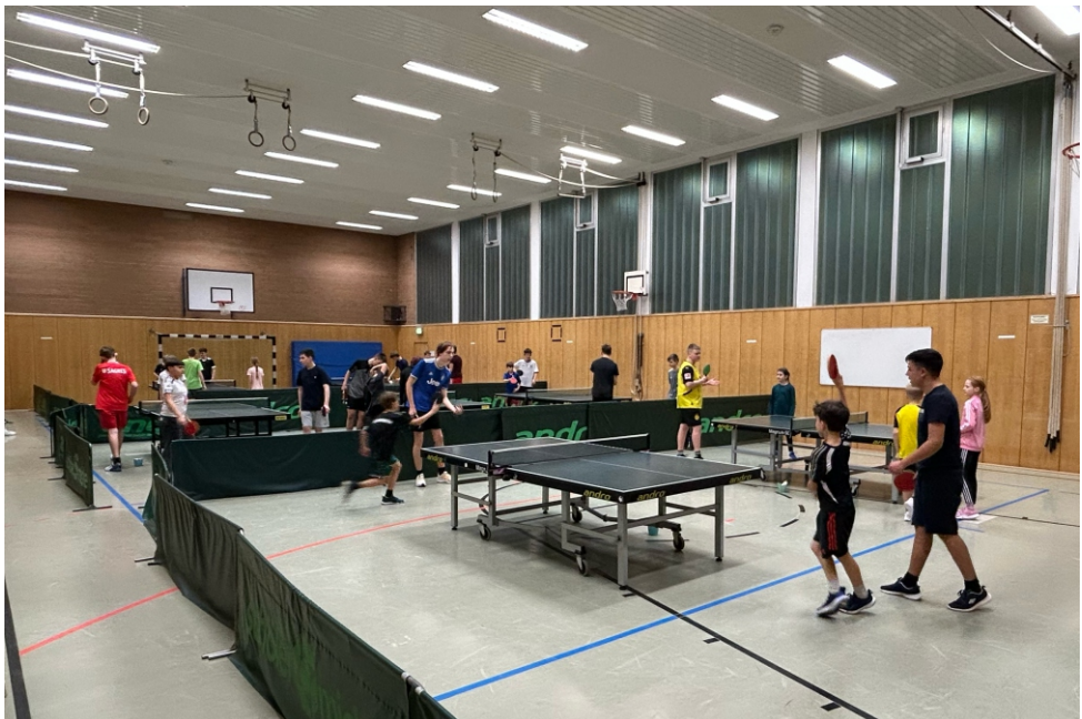
Die Tischtennisabteilung in Aktion - Training in der Grundschulhalle Lieberfeld